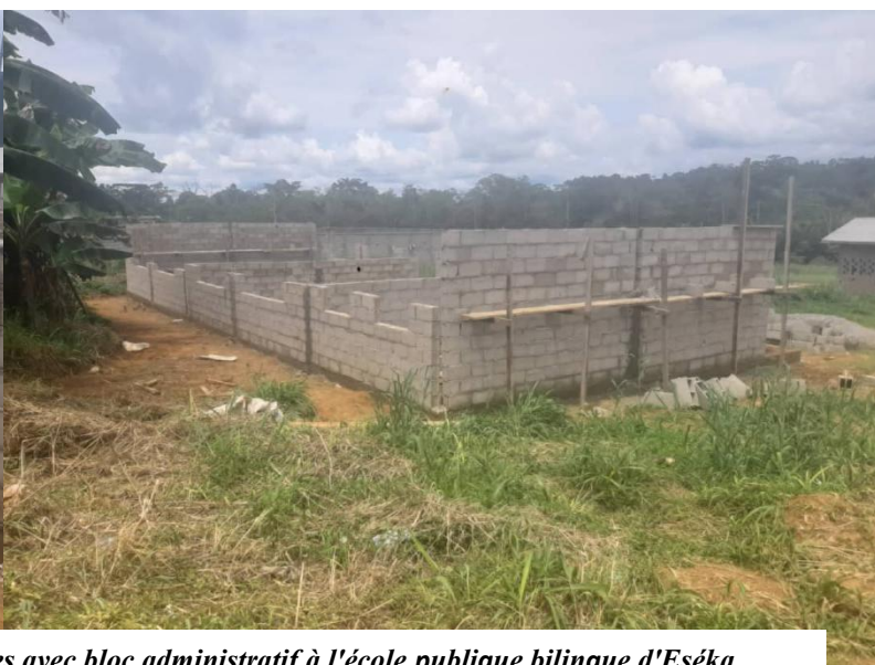
BIP 2024 : Construction d'un bloc de deux salles de classes avec bloc administratif à l'école publique bilingue d'Eséka