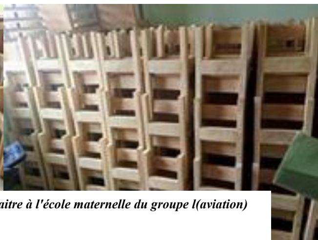
BIP 2024 : L'équipement en tables bancs et deux bureaux de maitre à l'école maternelle du groupe I(aviation)