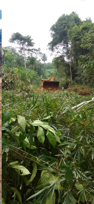
BIP 2024 : Travaux de réhabilitation de la piste agricole école publique de LISSAI- MNLOH MALOUMF