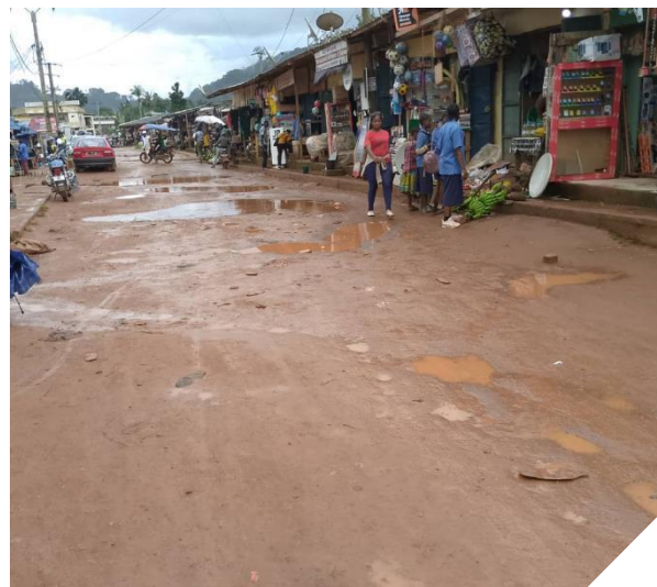
BIP 2024 : Travaux d'aménagement de la voirie urbaine carrefour ancienne gendarmerie - mosquée