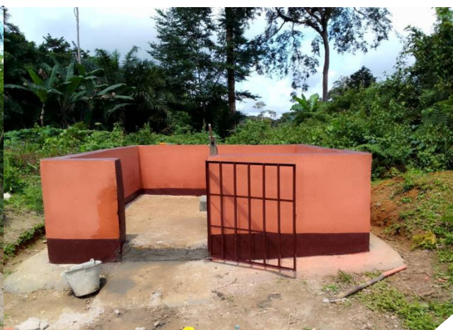
BIP 2024 : Construction de 12 forages équipés de PMH dans l'arrondissement d'Eséka