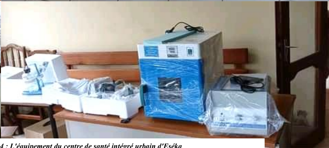
BIP 2024 : L'équipement du centre de santé intégré urbain d'Eséka