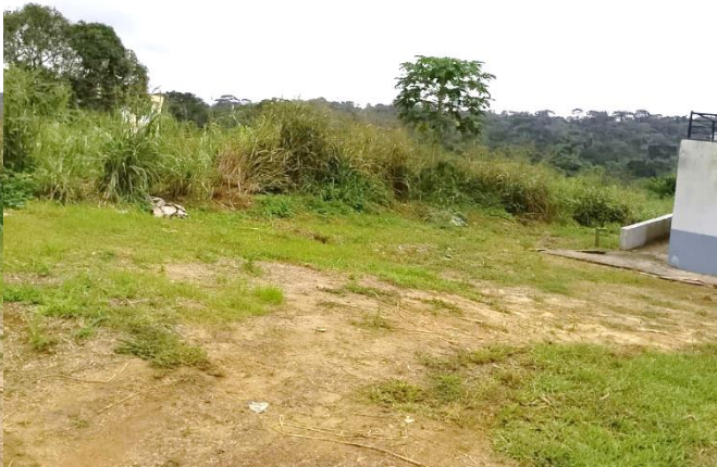
BIP 2024 : Construction d'un centre multimédia et spectacle