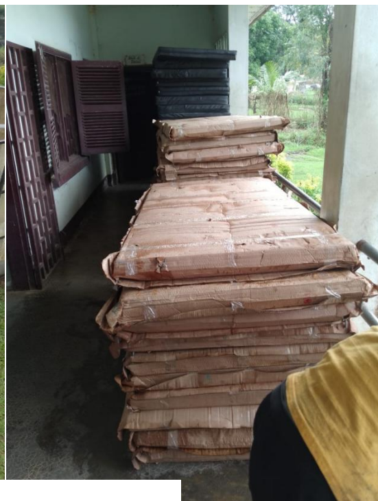
BIP 2024 : L'équipement du centre de santé intégré de