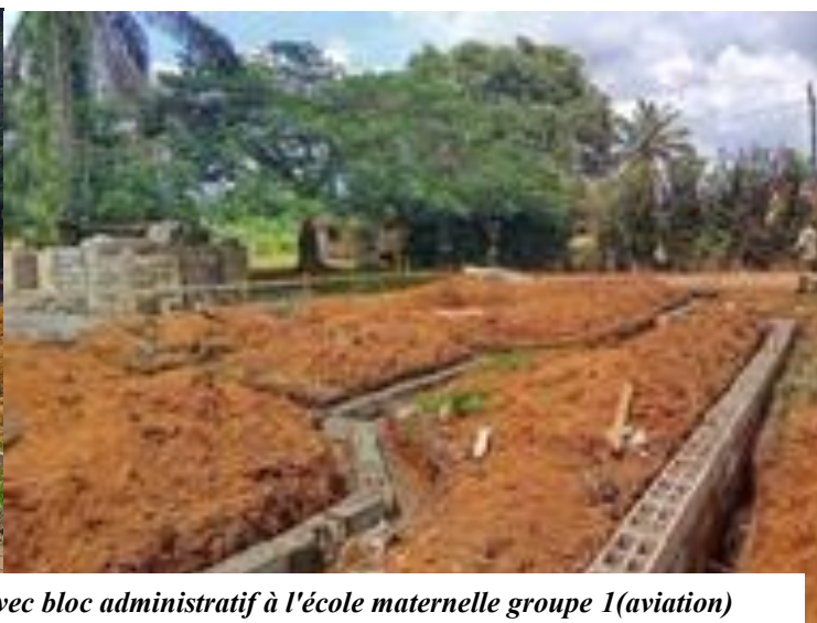
BIP 2024 : Construction d'un bloc de deux salles de classes avec bloc administratif à l'école maternelle groupe 1(aviation)